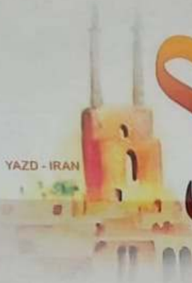
YAZD - IRAN

به مناسبت هفته کارآفرینی دانشگاه فنی و حرفه‌ای استان یزد برگزار می‌کند: